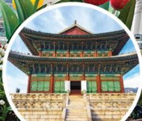
พระราชวังเคียงบกกุง (Gyeongbokgung Palace)