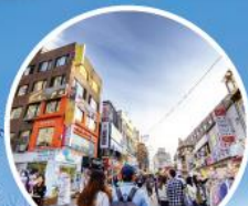
ย่านฮงแด (HONGDAE)