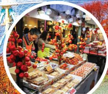
ย่านเมียงดง (MYEONG-DONG)